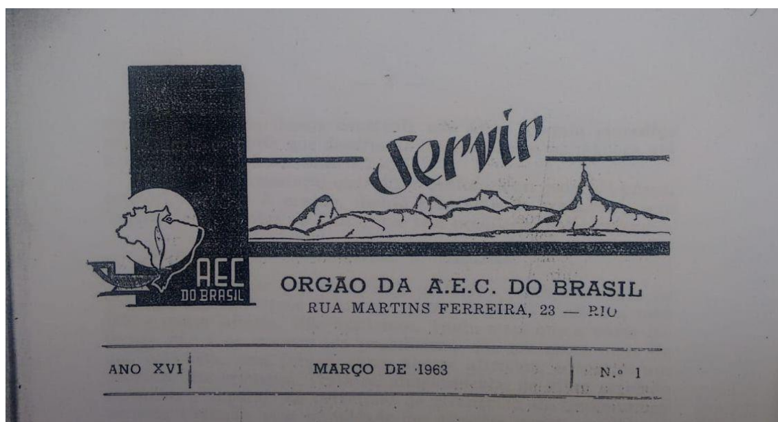
Arte da edição número 1 de 1963(digitalizada), editada e impressa na cidade do Rio do Janeiro

Para entender o campo de atuação e de influência dos educadores católicos nesse período, torna-se imprescindível uma pequena explanação acerca da entidade que era responsável pela criação e distribuição do periódico em questão: a Associação de Educação Católica (AEC) que, segundo Rossa “seria o braço estendido da hierarquia eclesiástica para os assuntos referentes à educação” (2005, p.146). Instituída em 1945 “como consequência do I Congresso Interamericano de Educação Católica empreendido em Bogotá” (GEN, 2006, p.12) teve em seus primeiros anos um caráter mais tímido, no âmbito de seu alcance e tamanho, a até então Associação de Educação Católica do Rio de Janeiro assume, a partir de 1952, aspecto nacional e passa a ter o nome de AEC do Brasil. Com o intuito de “reunir pessoas, em defesa da escola católica e aumentar a força das instituições escolares em vista da promoção da educação, à luz dos valores evangélicos que caracterizam um tipo de sociedade e de homem” (FÁVERO, 1995, p. 48), a AEC pôde, por meio da Revista Servir, construir uma rede de disseminação que permitiu a mesma afirmar seus ideais bem como fazer críticas aos modelos educacionais que iam contra a proposta católica de ensino, tendo em vista o cenário turbulento que se instaurara no Brasil nas últimas décadas no que diz respeito a modelos pedagógicos a serem seguidos.